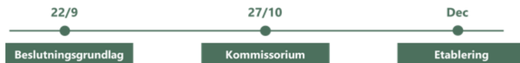
Figur 1: Tidsplan for etablering af 17,4-udvalg

Efter drøftelse af hvilke opgaver og temaer, som det særlige udvalg skal arbejde med, vil forvaltningen fremlægge forslag til kommissorium for 17.4-udvalget. Herefter videresender Arbejdsmarkeds-, Vækst- og Uddannelsesudvalget sagen til beslutning i kommunalbestyrelsen.