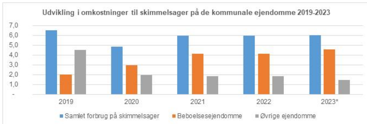
Figur 2: Udviklingen i omkostninger til skimmelsager på hele den kommunale ejendomsportefølje samt udviklingen i andelen for de kommunale beboelsesejendomme i perioden 2019-2023 (mio. kr.). *Udviklingen for hele 2023 er estimeret på baggrund af data fra januar til august samt udviklingen i fjerde kvartal for årene 2019-2022.

Udviklingen i antal og omkostninger til skimmelsager i de kommunale beboelsesejendomme kan tilskrives både bygningsrelaterede og adfærdsrelaterede forhold, og der er ofte tale om en kombination. De bygningsrelaterede forhold skyldes bygningernes alder og konstruktion og en del forhold løses over tid gennem renovering af ejendommene, der fortsat har et betydeligt vedligeholdelsesbehov. De adfærdsrelaterede forhold nedbringes gennem en vedvarende informationsindsats omkring hensigtsmæssig adfærd, der understøtter et godt indeklima og derved forebygger skimmelsvamp. Denne indsats er særlig vigtig, da en betydelig del af beboerne har brug for rådgivning og støtte om basale forhold som udluftning og rengøring.