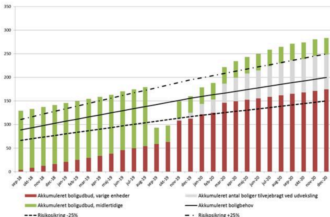
Figur 3: Opdateret boligstatus for varige boliger samt uændret kapacitet i de tilbageværende midlertidige indkvarteringssteder (september 2018 – december 2020)

Figur 3 viser, at med de nuværende opdaterede tidsplaner for de varige boligløsninger, vil der som følge af de justerede tidsplaner for varige boliger opstå mangel på ca. 40-60 boliger i den midlertidige indkvarteringskapacitet i efteråret 2019. Dette vil dog afhænge af de månedlige variationer i antal modtagne flygtninge, hvorfor forvaltningen vil vurdere dette nærmere i senere statussager. Såfremt en fremrykket udveksling i forhold til Venligboligplus/Tartuhus kan gennemføres, er det forventningen, at en stor del af denne udfordring vil kunne håndteres. Det bemærkes dog, at hvis udvekslingen af boliger i dette og øvrige almene byggeprojekter forsinkes eller ikke kan gennemføres som forudsat, vil der fra primo 2021 igen opstå mangel på boliger. Af hensyn til usikkerheden om ibrugtagningstidspunkterne for de almene nybyggerier vurderer forvaltningen det hensigtsmæssigt at opretholde den midlertidige indkvarteringskapacitet på Solbjerg frem til udgangen af 2020 eller evt. til udgangen af 2021.