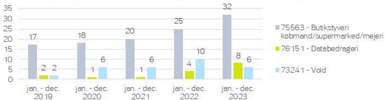
Figur 6: Top 3 gerningskoder med flest unikke sigtede under 18 år, Frederiksberg Kommune